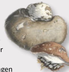
Birken-Porling ( Fomitopsis betulina )

Dieses Wissen besaß bereits der Gletschermensch Ötzi vor mehr als 5.000 Jahren! Der Birkenporling wirkt u. a. antibakteriell und entzündungshemmend bei Wundverletzungen und kann die Immunabwehr anregen. Doch Pilze finden nicht nur in der Medizin, sondern auch in der Industrie vielfältige Anwendung.