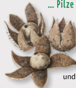
Wetterstern ( Astraeus hygrometricus )

Die Lappen des Wettersterns öffnen und schließen sich je nach Witterung. Aufgrund ihrer „Wetterfähigkeit“ rollen sich die Lappen bei Trockenheit nach oben. Der Wind kann so den kugelähnlichen Fruchtkörper leichter bewegen und Sporen können besser verbreitet werden.