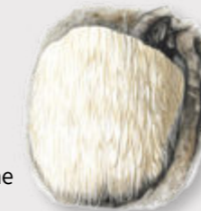
Igel-Stachelbart ( Hericium erinaceum )

Der Igel-Stachelbart ist in Deutschland stark gefährdet. In Europa kommt er nur in Buchenwäldern vor, in denen alte Bäume stehen. Deswegen gilt: Absterbende Bäume auch mal stehen lassen!