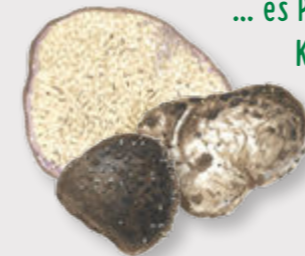
Douglasien- Wurzeltrüffel ( Rhizopogon villosulus )

Auch mit dieser Strategie werden Lebewesen angelockt, die die Pilzsporen verbreiten sollen. Die Douglasien-Wurzeltrüffel wird durch Wildschweine und Rehe verbreitet.